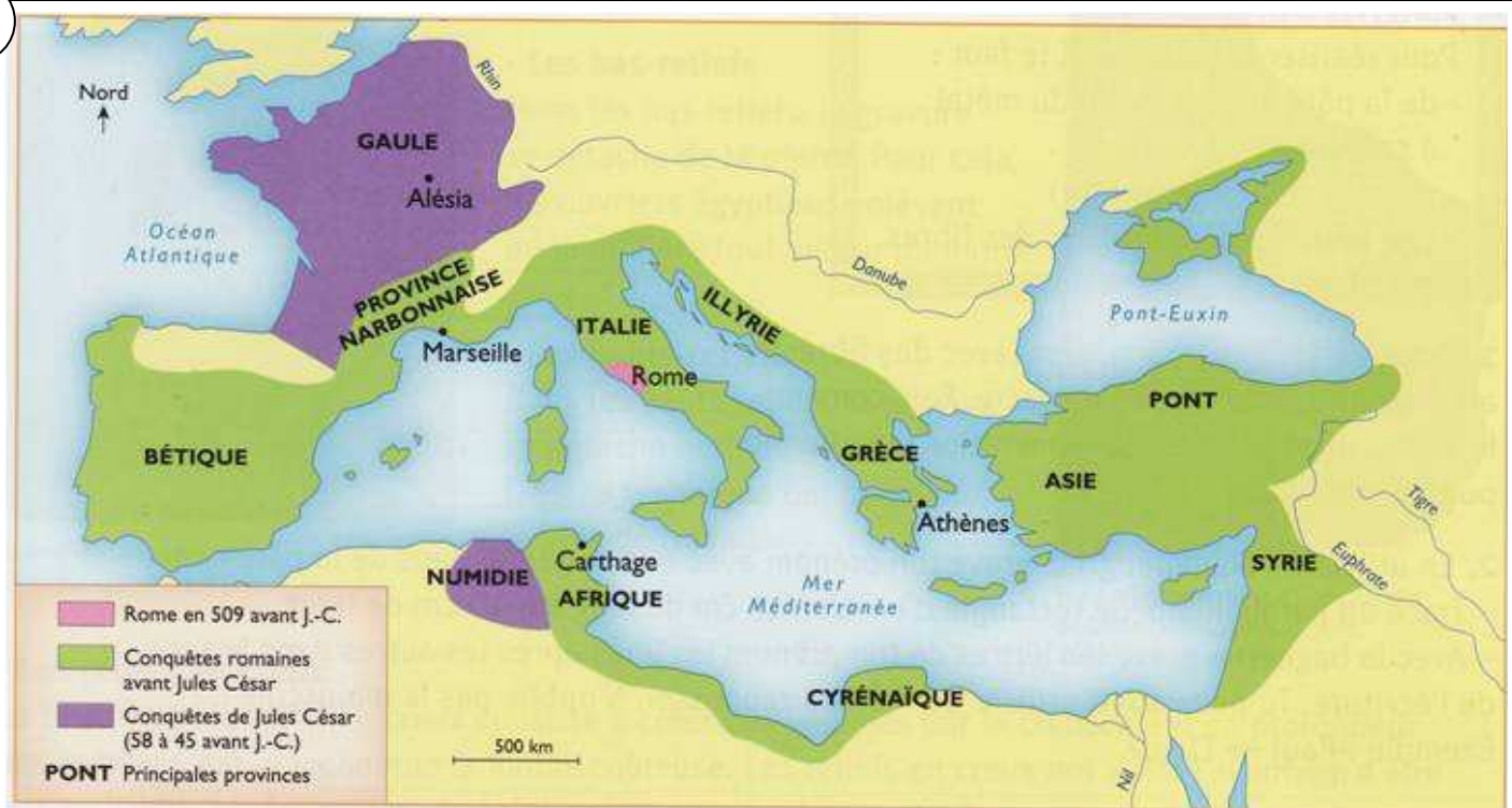
Les conquêtes romaines au temps de Jules César