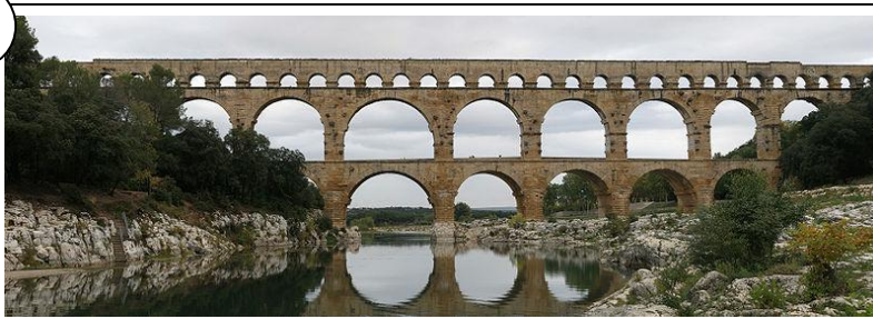
Le pont du Gard, I er siècle ap. J.-C.

Long de 275 m, le pont du Gard comprend trois étages et s'élève à 48 m au-dessus des eaux du Gardon. Certains blocs de la partie haute pèsent plus de six tonnes. L'aqueduc alimentait en eau la ville de Nîmes, tandis que la partie basse facilitait le déplacement des troupes, donc le contrôle du territoire et le transport des marchandises.