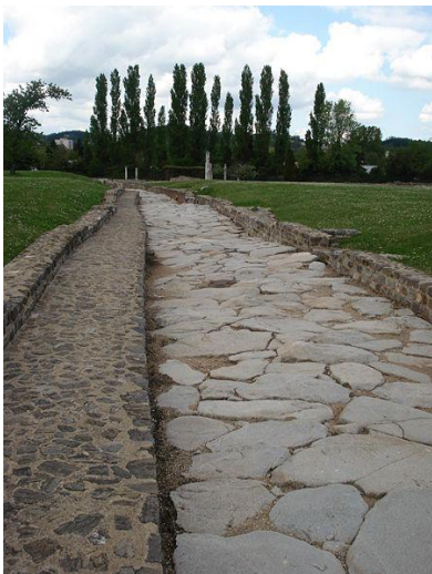
Voie romaine à Saint-Romain-en-Gal