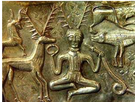
Toutatis et Cernunnos, détails du chaudron de Gundestrup