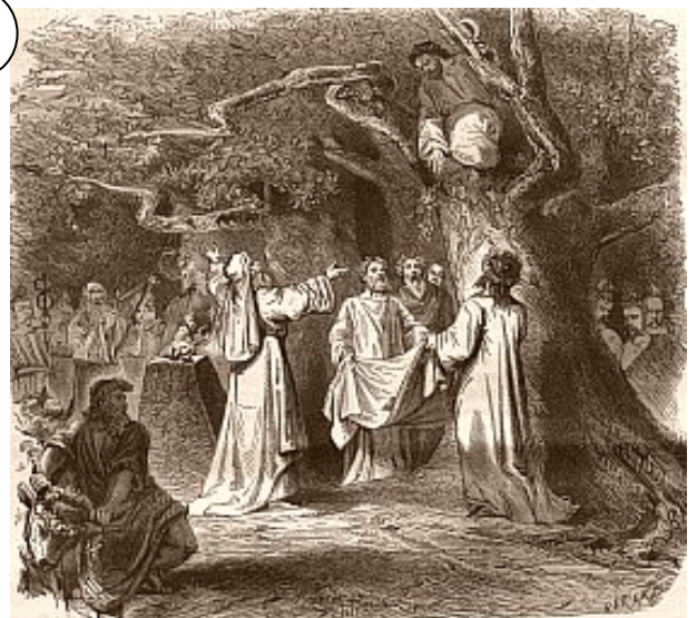
La coupe du gui