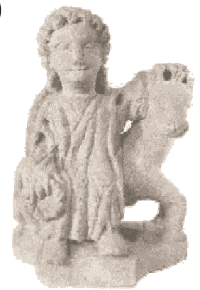
Déesse Epona, II ème s. av. J.-C.