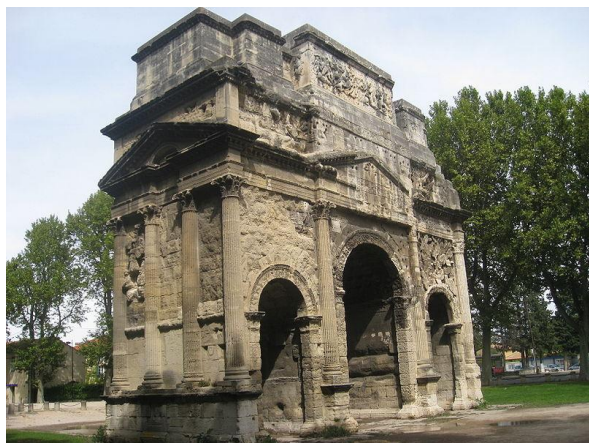
Arc de triomphe d'Orange (Vaucluse)