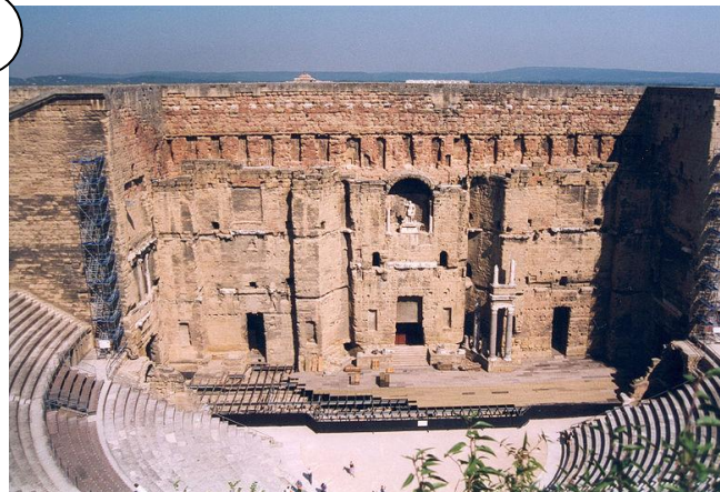
Théâtre antique d'Orange (Vaucluse)