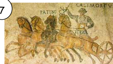
Course de chars