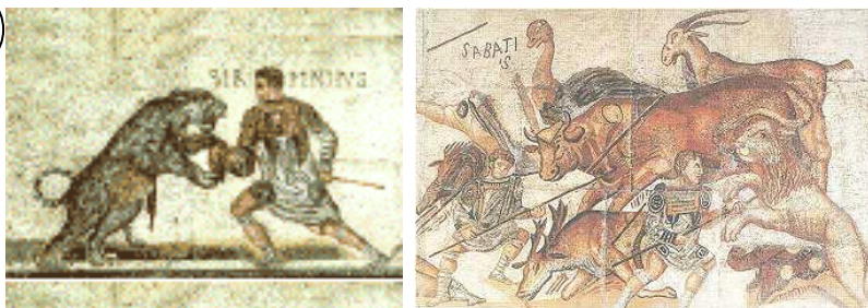
Les jeux pratiqués dans les arènes : animaux et gladiateurs