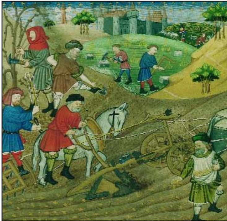
La seigneurie (enluminure de manuscrit du xv e siècle)