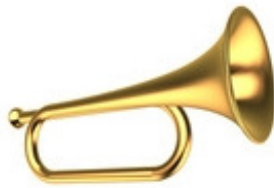
trom mp ette