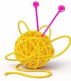
em mm êlé