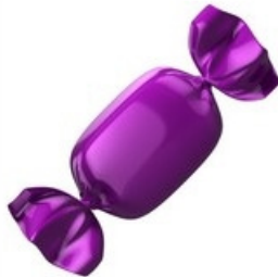
bon nb on