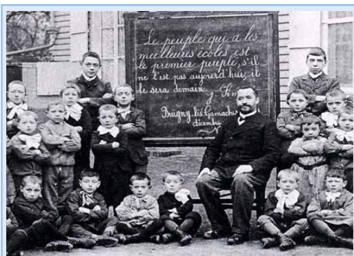
Doc 6 : une école au début du XX ème siècle