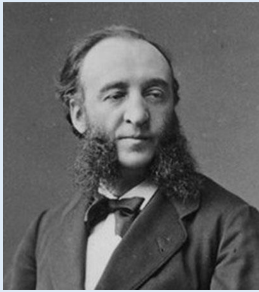
Doc 4 : Jules Ferry

Sous la III ème République, La France devient une démocratie parlementaire dotée d'une Assemblée de députés élus au suffrage universel masculin et d'un Sénat qui forment à eux deux le Parlement . Le Parlement vote les lois et choisit un Président de la République pour une période de sept ans . Ce dernier nomme les ministres qui forment son gouvernement. La Marseillaise devient l'hymne national et le 14 juillet devient jour de fête nationale.