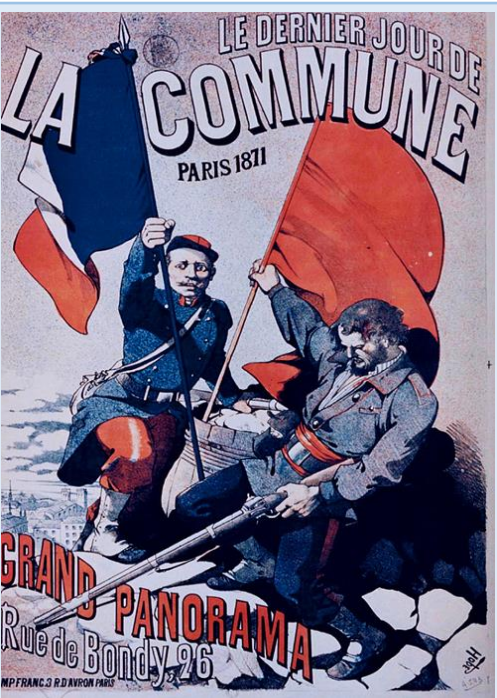
Doc2 : soldat versaillais contre communard

Le gouvernement de Thiers, qui s'est réfugié à Versailles pendant les combats décide de donner l'assaut. L'armée versaillaise entre dans Paris.