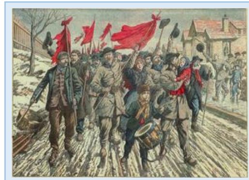
Doc 7 : Grève de mineurs