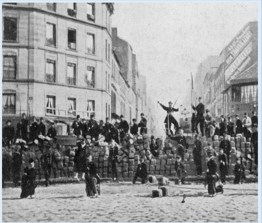
Doc 3 : Communards sur les barricades