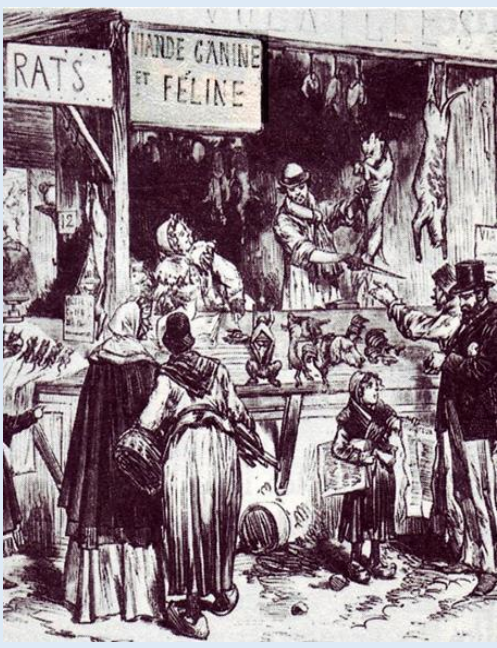
Doc 1 : Boucherie canine et féline pendant les sièges de Paris

La III ème République est proclamée le 4 septembre 1870 mais les armées prussiennes ont envahi la France et encerclent Paris. La population affamée en est réduite à manger chiens, chats et même des rats pour survivre. Les animaux des zoos sont même sacrifiés pendant le dur hiver de 1871. La France n'a d'autre choix que de capituler le 18 janvier 1871 . Elle perd l'Alsace et la Lorraine.