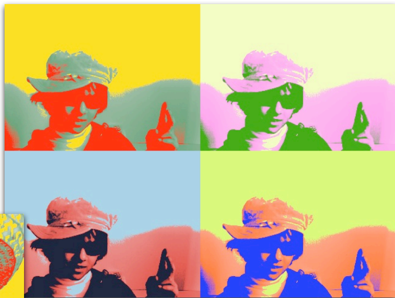
-Warhol Collection Tashen