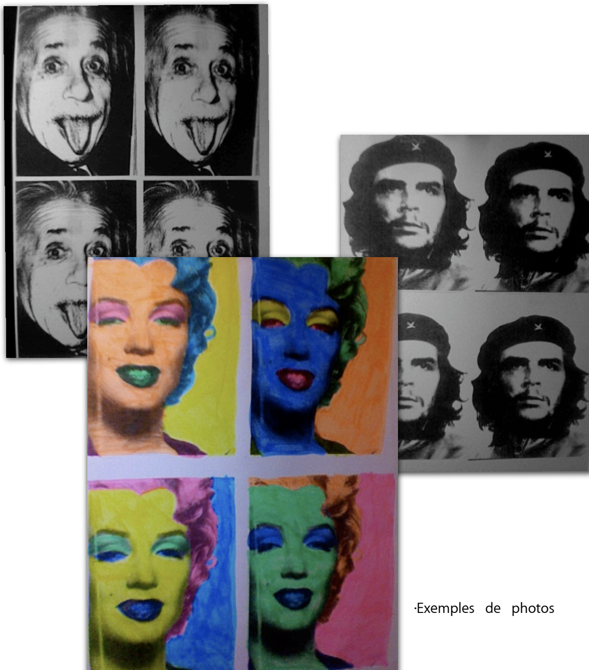
·Exemples de photos