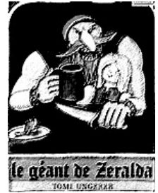
Ed. L'école des loisirs

L'ogre est une figure mythique remontant aux origines qui révèle la démesure de sa force de vie et de mort. Reflet terrifiant du Moi, il symbolise beaucoup d'interdits.