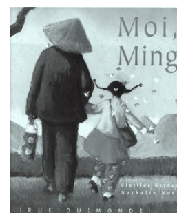
Illustrations Nathalie Novi