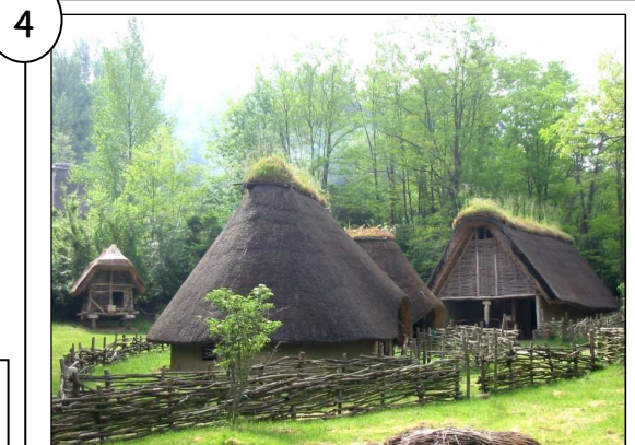
Reconstitution d'un village gaulois.

Texte issu de Histoire cycle 3 , Magellan (Hatier)