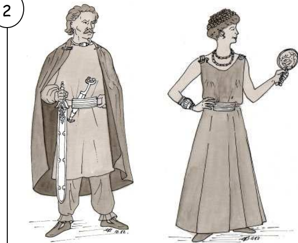
Représentations d'un Gaulois et d'une Gauloise.

Diodore de Sicile, historien grec du 1er siècle av. J.-C